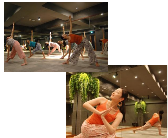
1 回 60 分、豊富なレッスンプログラムを提供

※マグマスパスタジオは、（株）マグマスパジャパンが特許を持つ体温上昇スタジオです。 マグマスパジャパン社 http://www.magmaspa.jp/