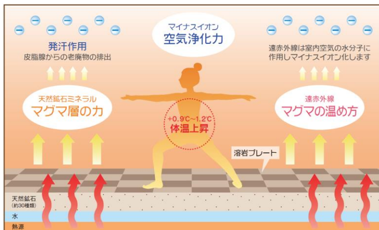
マグマ・スパ・スタジオのしくみ

「ほどよくラグジュアリーなホット体験をラクに---」。そんなネーミングの由来を持つ新ブランドを立ち上げ、ティップネスは、今後も現代人の様々なニーズに応えるべく、多様な形態でのサービス提供を模索していきます。